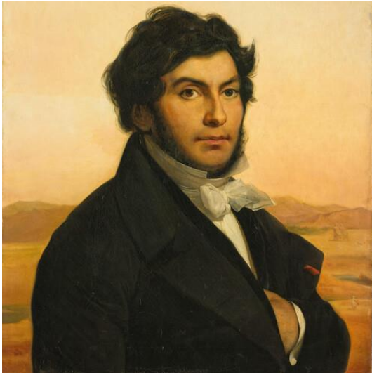
Portrait de Jean-François Champollion par Léon Coignet France, 1831 Peinture à l'huile sur toile Musée du Louvre, inv. 3294