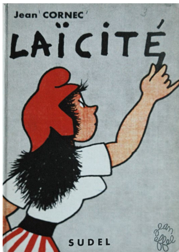
Jean Cornec, Laïcité , illustrations de Jean Effel, Sudel, 1962 OADAGP 2015

Pour aller plus loin : www.classes.bnf.fr/laicite