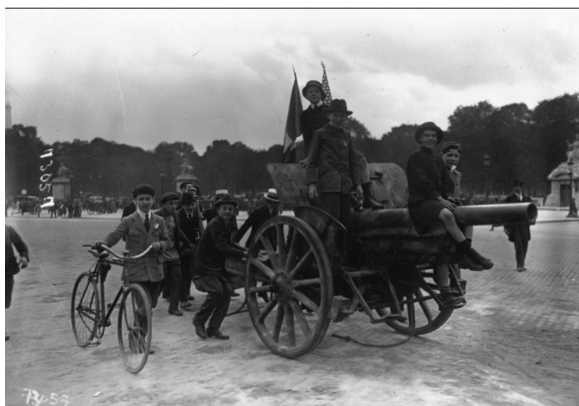
Place de la Concorde, enfants traînant un 77 boche Agence photographique Meurisse, 1919

Ville de Paris / Fonds Heure joyeuse, 2013-44926 http://gallica.bnf.fr/ark:/12148/bpt6k65116692/f32 Provenance : bnf.fr