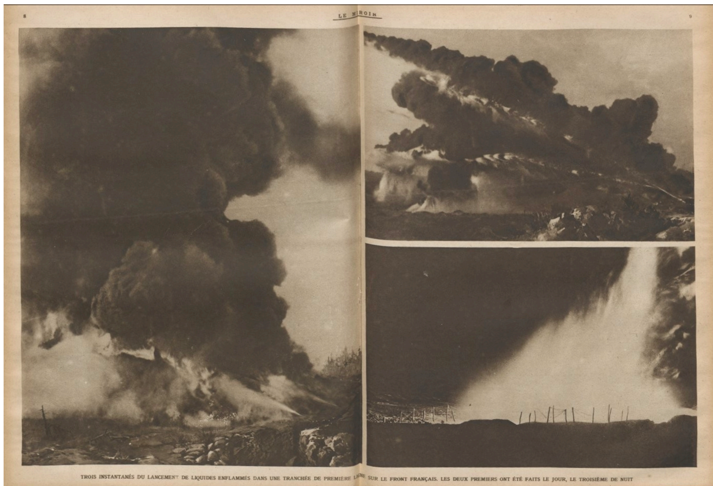
TROIS INSTANTANÉS DU LANCEMENT DE LIQUIDES ENFLAMMÉS DANS UNE TRANCHÉE DE PREMIÈRE LIGNE SUR LE FRONT FRANÇAIS. LES DEUX PREMIERS ONT ÉTÉ FAITS LE JOUR, LE TROISIÈME DE NUIT