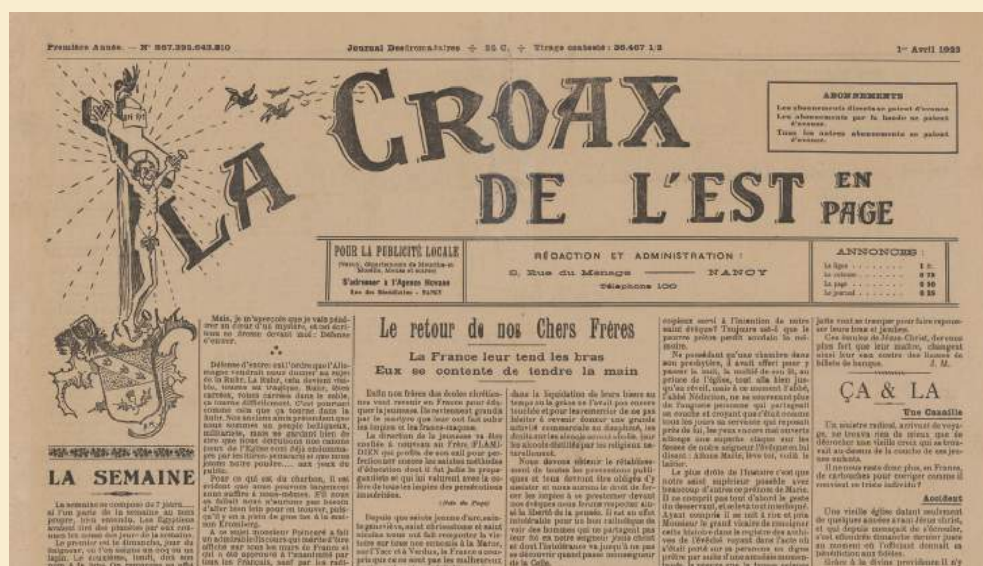
La Croix de l'Est, n°18, 1er avril 1923 // «La Croix de l'Est» publié dans Le Journal surprise, 1er avril 1923 La Fédération de libre pensée de Meurthe-et-Moselle publie en guise de poisson d'avril ce pastiche anticlérical du journal La Croix en supplément de son bulletin trimestriel.

«L'Alphonse» publié dans Le Tintamarre, 11 juin 1882 En mai 1882, la presse annonce un projet de loi concernant les proxénètes, ces «messieurs à haute casquette» (Le Figaro, 1er mai 1882). Le Tintamarre participe au débat public avec «L'Alphonse» qui décline tout le vocabulaire argotique de la prostitution, du registre marin au registre alimentaire, comme le persil, «argent gagné par les prostitués».