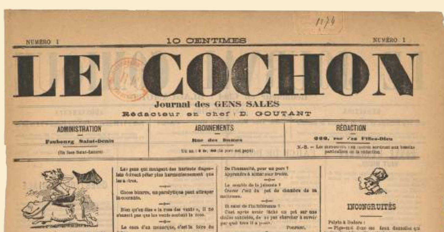
«Le Cochon» publié dans Le Journal comique, 1885 Le Cochon, journal des gens sales joue avec au moins trois sens différents du mot «cochon», autant de catégories de lecteurs improbables visés.

Kamel Abdessadok et Xavier Laurant, «Hotte vidéo», Le Kiosque, Les Requins Marteaux, 2020 Ce magazine spécialisé dans les systèmes d'aération de cuisine s'inspire d'un mensuel dédié au cinéma pornographique. © 2020, Kamel Abdessadok & Xavier Laurant, Les Requins Marteaux éditions